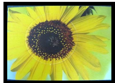
Karte mit Saatteller